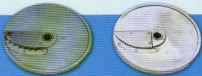
H7 H3 Desfiador quadrado / Crimping slicer / Corte quadrado ( 7 mm ) — ( Juliene ) — ( 3 mm )