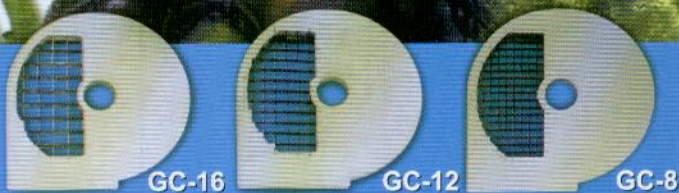
GC-16 GC-12 GC-8 Grade cubo / Dicing / Cubos ( 16 mm x 16 mm ) — ( 12 mm x 12 mm ) — ( 8 mm x 8 mm )