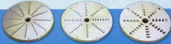
Z8 Z5 Z3 Desfiadores / Shredder / Deshiladores ( 8 mm ) — ( 5 mm ) — ( 3 mm )