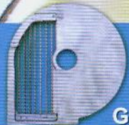
GP Grade palito / French fry / Corte baston ( 10 mm )