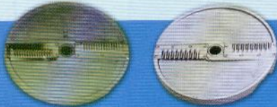
W4 W2 Cortador ondulado / Scallop Cut / Cortador ondulado ( 4 mm ) — ( 2 mm )