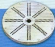
V Ralador / Grater / Rallador